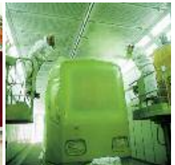
En tant que pompe d'alimentation pour plusieurs pistolets de pulvérisation la pompe WIWA PROFESSIONAL prouve sa force sur des chaînes d'application spécifiques.