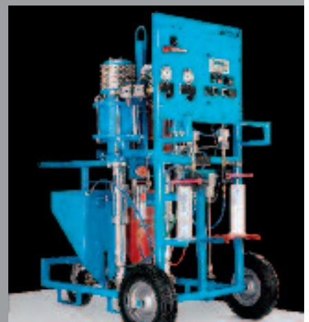
WIWA FLEXIMIX Dosage électronique