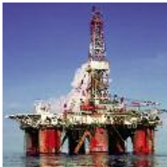
La protection anticorrosion des constructions offshores requiert une technologie robuste.