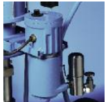
Le réchauffeur chauffe les produits constamment et rapidement.