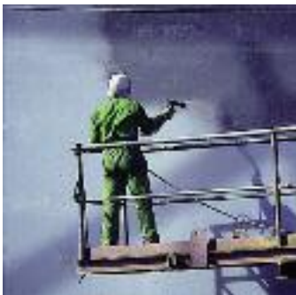
La couverture de grande superficie fournie par des pompes WIWA PROFESSIONAL satisfait les demandes de la construction maritime. Des hauts rapports pression évitent la perte de charge sur des longues distances de tuyaux.