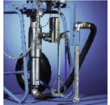
L'agitateur et le système d'aspiration sont installés exactement d'après les demandes individuelles.

L'assurance est la performance déjà mentionnée, la mise en service facile et la longévité de renommée mondiale.