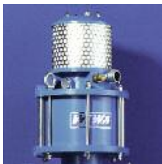
Une adaptation simple du rapport de pression grâce à l'échange du piston et du cylindre.