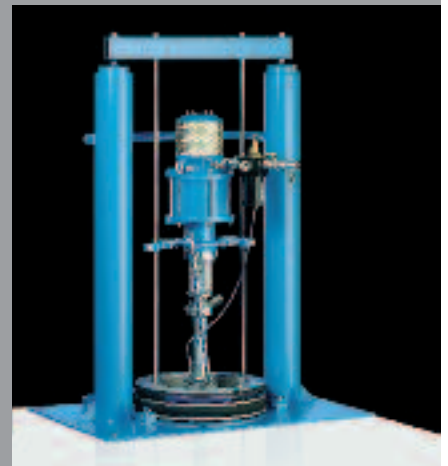
WIWA Plateaux Pousseur