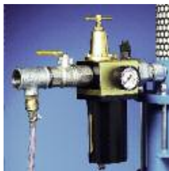
L'unité de maintenance est installée sur l'équipement.