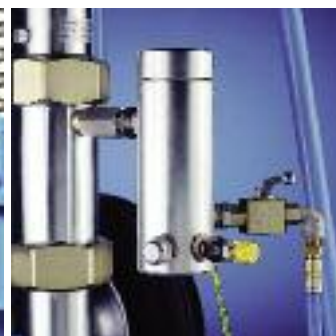
Filtre haute pression situé à la sortie de la pompe