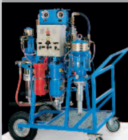
WIWA DUOMIX Unité de pulvérisation multi-composants