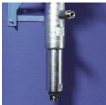
Grâce à un montage spécifique l'assemblage et désassemblage du moteur et du bas de pompe sont simples et précis.