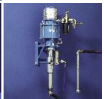
avec chariot élévateur (image à gauche) avec support mural (image en haut)