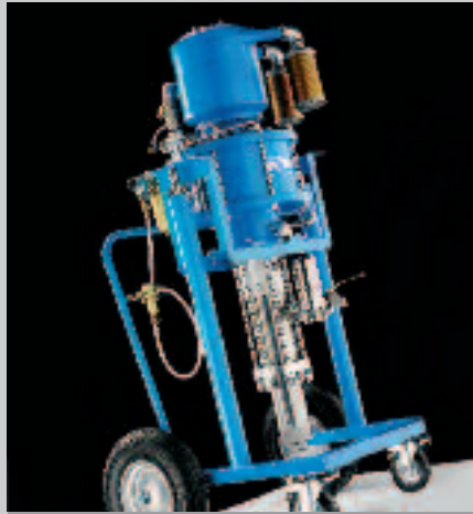
WIWA Equipements de pulvérisation Airless