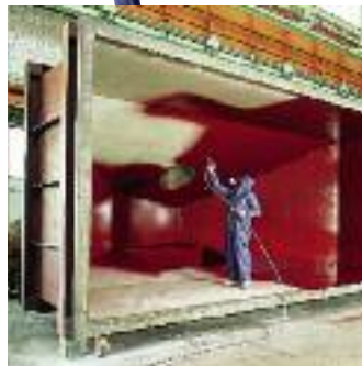
Dans la construction métallique on demande une haute performance et une bonne maniabilité.