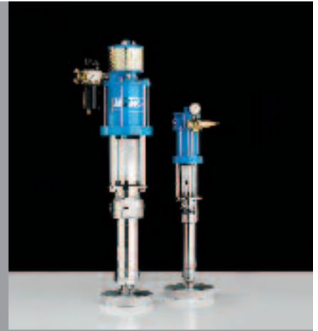
WIWA Pompes de transfert des fluides